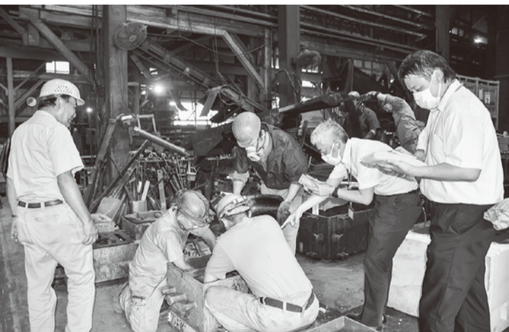
鋳物製品が作られる過程をライブ配信

「た」との回答が94%に達した。交渉を行った企業に結果を聞いたところ、「大半の製品で転嫁できないが多かったのが「6〜8割の製品で転嫁できた」の34%。「半分程度転嫁できた」「2〜3割の製品で転嫁できた」が10%となった。