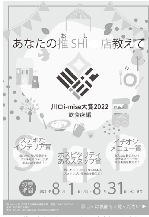
各賞に合うあなたの「推SHI」店を投票しよう

川口商工会議所は「川口i-mise大賞2022」飲食店編あなたの「推SHI」店教えて」を開催する。 川口市内には、まだまだ知られていない、いい店(i-mise)が多