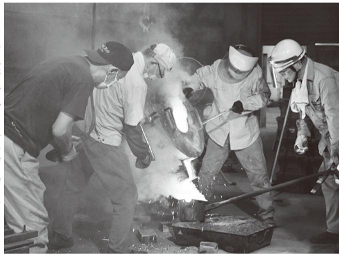
ルツポ炉からブロンズの湯を湯くみに

シあたりの約50キログラムで、計200キログラムを注湯した。会員のうち約20人が立ち会った。 今年度は初心者を対象にした「本科」に3人が参加しており、本科の最初の課題作品であるペーパーウェイトにも注湯が行われた。 会員が準備した作品は、花器や香炉、火鉢、レリーフ、ペーパーウェイト、キャンドルスタンドなど様々。来年の干支であるウサギをモチーフにした作品も目立った。