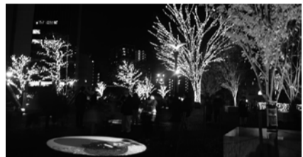
光の輝きが街を彩る

「かわぐち光のファンタジー2022」は2月14日まで18時〜23時に開催中。爽やかなブルーをメインに約28万級の光が、癒しの空間