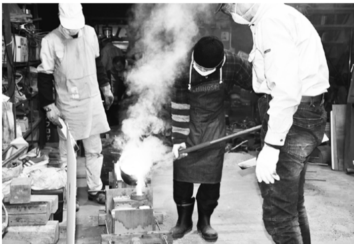
ブロンズの湯を型に注ぎ込んだ

湯入れは1年間に鑄鉄とブロンズで各2回計4回行っており、2022年度に入ってから2回目。この日は同研究会のルツボ炉を使って銅合金のスクラップなどを溶解。川口鑄金工業教室の会