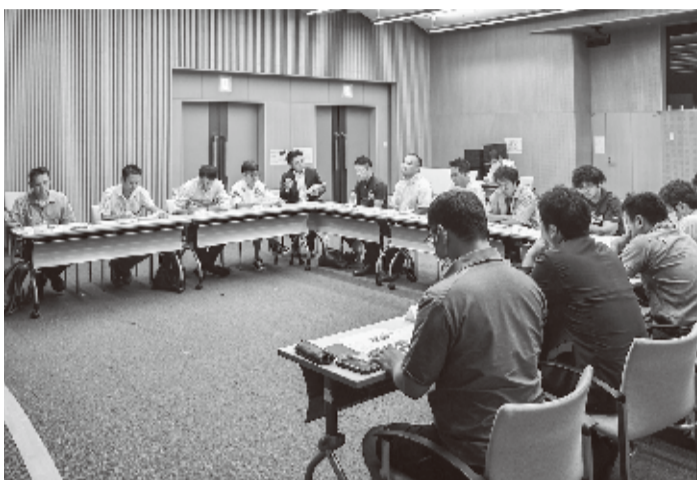
用意した資料を見ながらなどそれぞれのスタイルで説明