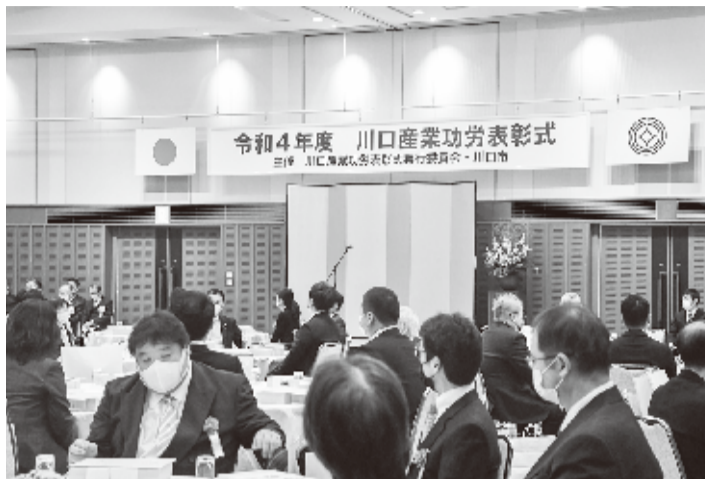
昨年の永年勤続優良従業員表彰式