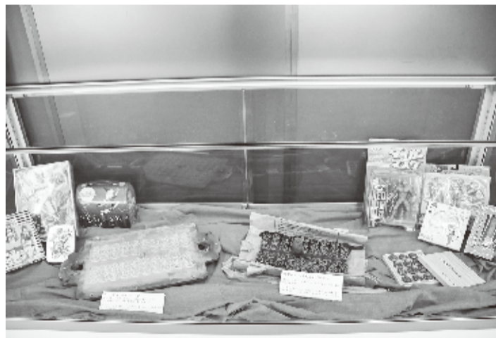
ショーケース内には「ペーゴマのアルミ型」など