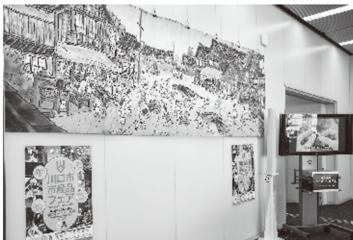
製造方法など動画で上映中